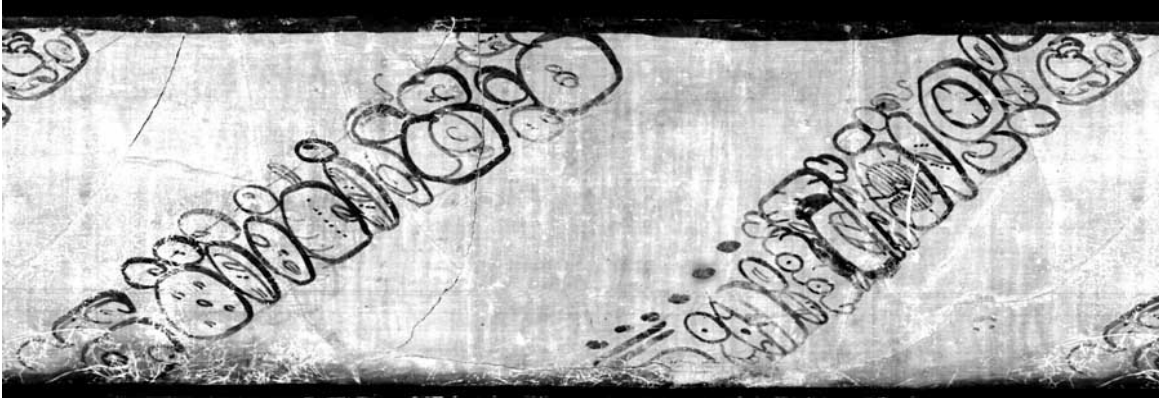
Figura 3. vaso K5022

Es interesante observar que el primer bloque de la inscripción, el signo inicial ( alay ), esta escrito de clara manera (a-LAY-la-ya). Esta colocación es en extremo rara en la escritura maya. Hasta tiempos recientes, este glifo se resistía al desciframiento justamente por la ausencia de una substitución silábica que permitiera leer el logograma LAY (cf. Boot 2003).