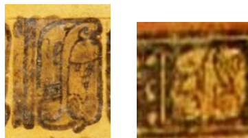
Figura 2b. El título 7 Tzuk (K1398 de Naranjo; K2730 de La Corona?)

Hasta ahora, es difícil de entender el significado preciso de este título. Lo que parece claro mirando las diferentes definiciones encontradas en los diccionarios es que se trata de un título relacionado con el concepto de “pueblo, provincia” (cf. cuadro). Además, tzuk es también mencionado como clasificador numeral para contar pueblos. El hecho de que esta palabra se encuentra con varios coeficientes indica que es probable que debemos considerar tzuk como un clasificador numeral.