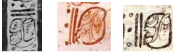
Figura 2a. El título Uxlaju'n Tzuk sobre tres cerámicas del Petén oriental (© Justin Kerr, K2295 de Río Azul; K7459 de Xultun-Río Azul; y K8015, from Xultun)

13) y la palabra tzuk . Su significación no está muy clara, pero parece funcionar como un “marcador regional”. En efecto, conocemos otras variantes del título donde cambia el coeficiente. Así, en la región de Xultun-Río Azul, el título presenta casi siempre un coeficiente de 13. En el área de Naranjo, el coeficiente es siempre el número 7 (cf. K0635, 1398, 7750; Naranjo stela 8, 13 y 19).