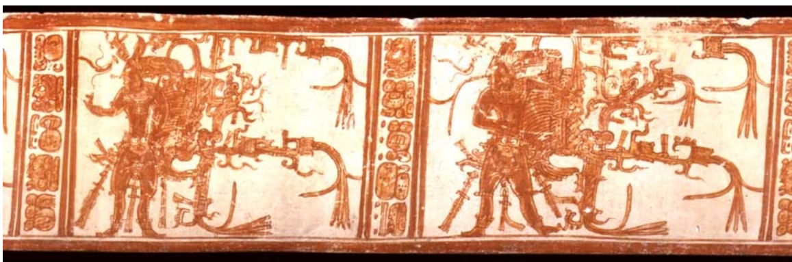
Figura 1. vaso K7720

El objetivo de este artículo es presentar dos vasijas mayas del fin del periodo clásico. Como será expuesto mas tarde, estos dos artefactos cerámicos fueron elaborados en el área adyacente a la ciudad de Rio Azul. Esta ciudad ha producido algunas de las mas finas cerámicas pintadas (cf. K1383, 1446, 2914, 7524...). Aunque la mayor parte de las vasijas conocidas de Rio Azul son producto de saqueo, es ahora posible saber su procedencia gracias a criterios estilísticos y epigráficos.